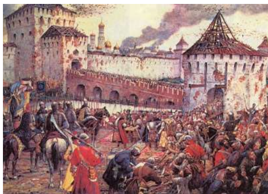
«Изгнание поляков из Кремля» Э. Лисснер