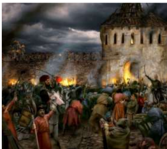
«Битва за Москву в 1612 г.»