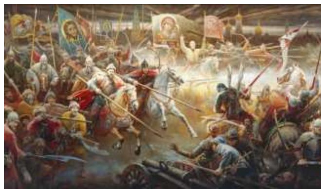
Гермоген Кречет Картина из серии «Минин и Пожарский»