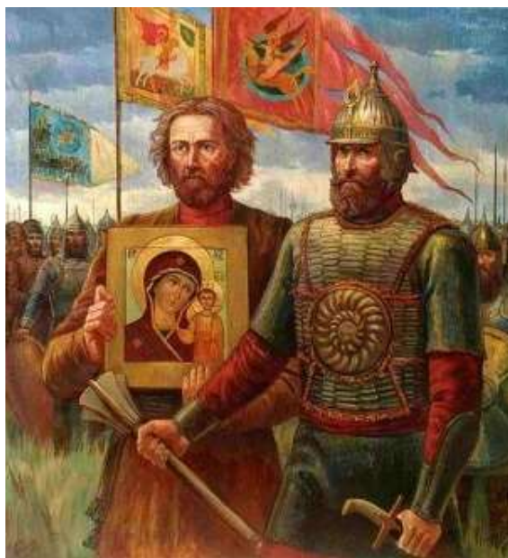
Картина «Минин и Пожарский»